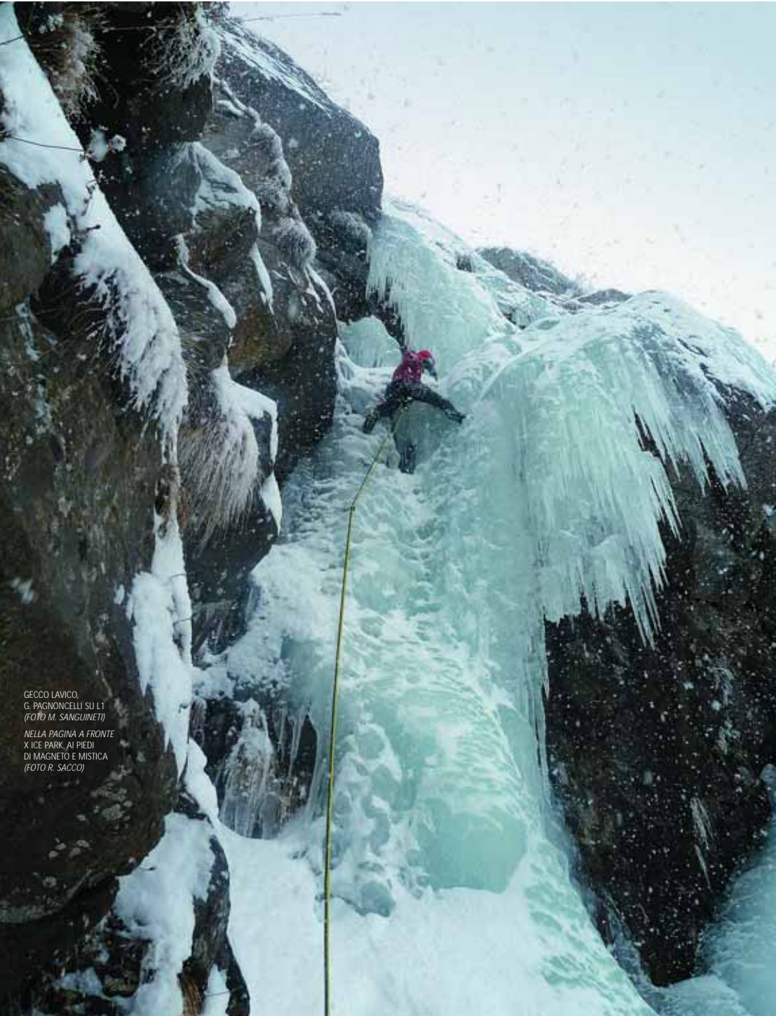
GECCO LAVICO, G. PAGONCELLI SU LI1